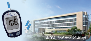
ACEA (Real-time Cell Assay)