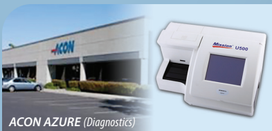
ACON AZURE (Diagnostics)